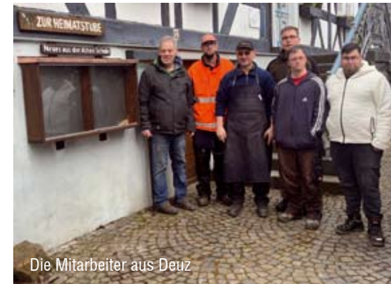
Die Mitarbeiter aus Deuz

Für die Erneuerung der Fassade wurden die ersten formalen und fachlichen Vorarbeiten in Gang gesetzt. Dazu gehören die Beantragung des denkmalrechtlichen Einvernehmens, die Einholung von Angeboten und die Generierung von