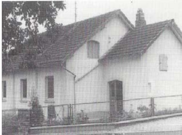
Kapelle Holzhausen Hainstraße

Gemeinde gegründet. Das erste Gemeindehaus für Holzhausen wurde rechtzeitig zur Gründung in der Hintergasse (heute Hainstraße) errichtet. 1979 wurde das Gemeindehaus am jetzigen Standort (Zum Großen Stein 16) fertiggestellt, wo wir nach zwei weiteren Anbauphasen bis heute beheimatet sind.