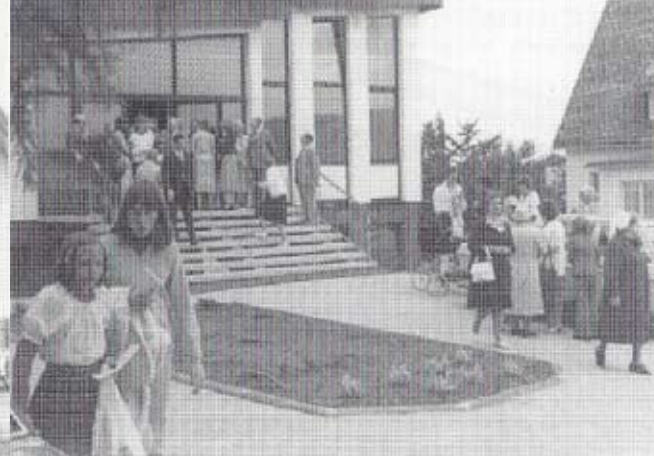
Einweihung Gemeindehaus Zum Großen Stein 1979

An jedem Tag der Woche finden abwechslungsreiche Programmpunkte, Vorträge, Aktionen und Begegnungsangebote statt – mit Angeboten für Kinder, Jugendliche, Familien, Senioren und Interessierte. Ob Musik, Erlebnisberichte,