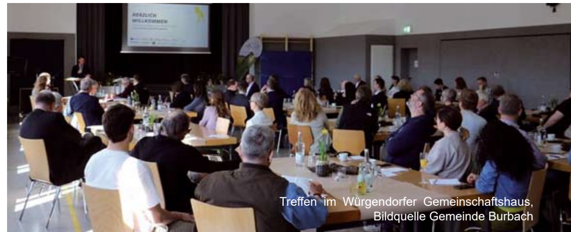
Treffen im Würgendorfer Gemeinschaftshaus