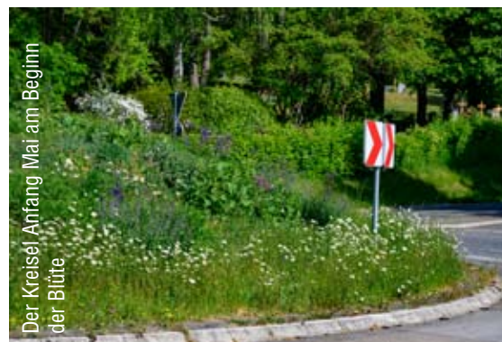
Der Kreisel Anfang Mai am Beginn der Blüte

„Was wird aus dem grünen Hügel des Verkehrskreisels“, so lautete die Überschrift in der März Heimatspiegelausga-