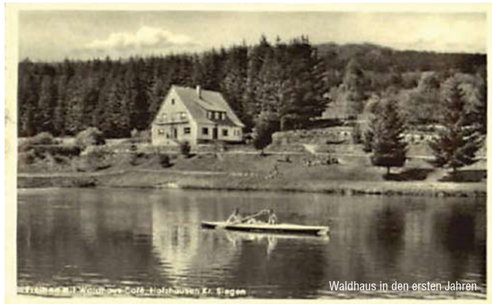
Waldhaus in den ersten Jahren