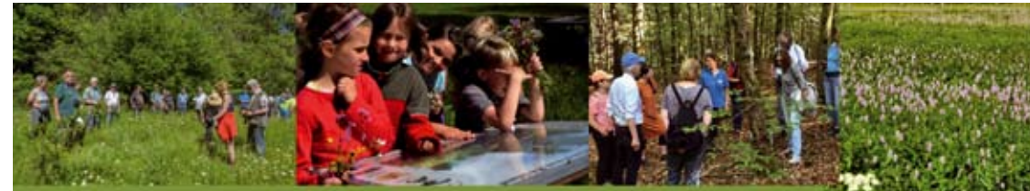
Exkursionen - Wissensvermittlung – Ausstellungen– Natur und Landschaft

Auch der kleine Tagungsbericht über das Umwelt Dorfgespräch ist dort eingestellt.