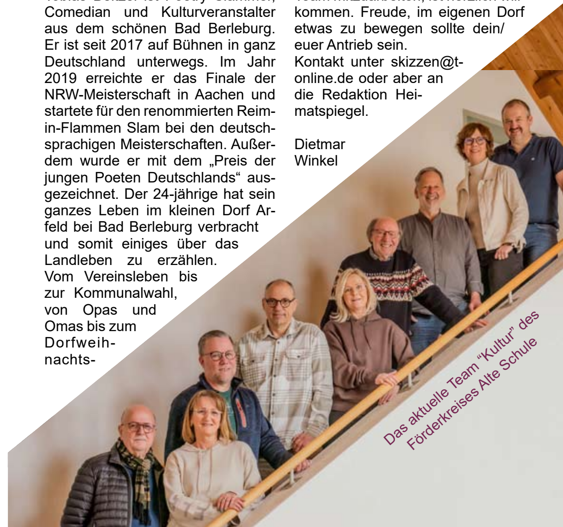
Das aktuelle Team „Kultur“ des Förderkreises Alte Schule