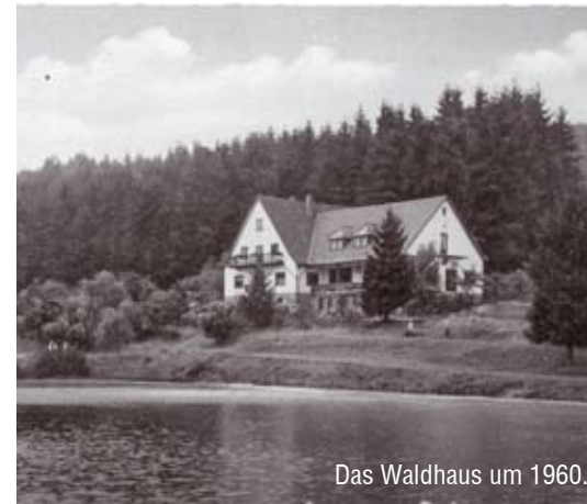
Das Waldhaus um 1960.