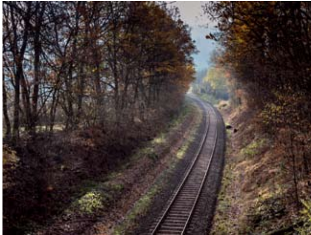
Abstellort des Munitionszuges heute, Blickrichtung Ndf.

Im 10 km entfernten Hickengrund verbreitete sich blitzschnell das Gerücht, einige von uns einheimischen Fahrschülern seien schwer verwundet oder sogar umgekommen. Sofort machte sich von unseren Angehörigen, wer eben konn-