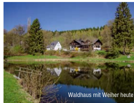
Waldhaus mit Weiher heute