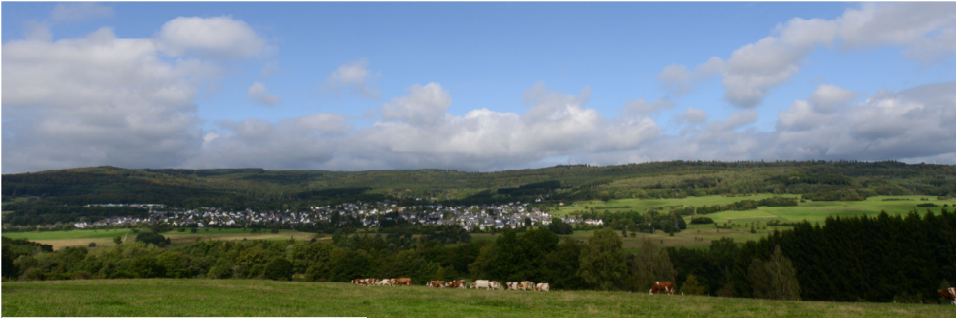
Blick vom Ölberg auf Holzhausen